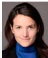
M. Carmignac Gérante

Un objectif de faible volatilité et de performance régulière décorrélée des tendances de marchés