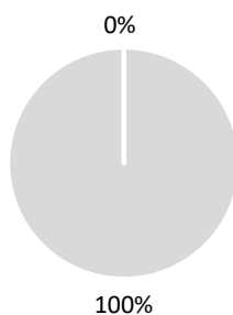
2. Ajuste a la taxonomía de las inversiones, excluidos los bonos soberanos*