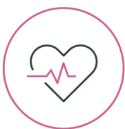
SALUD Y BIENESTAR