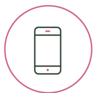
DIGITALIZACIÓN Y LA NUBE