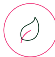
LA « CLIMATE TECH »