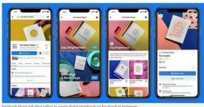
Facebook Shops will allow sellers to create digital storefronts on Facebook or Instagram

Facebook Shops permitirá a los vendedores crear escaparates digitales en Facebook o Instagram.